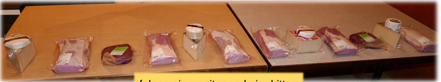
folgen ein zweiter und ein dritter.