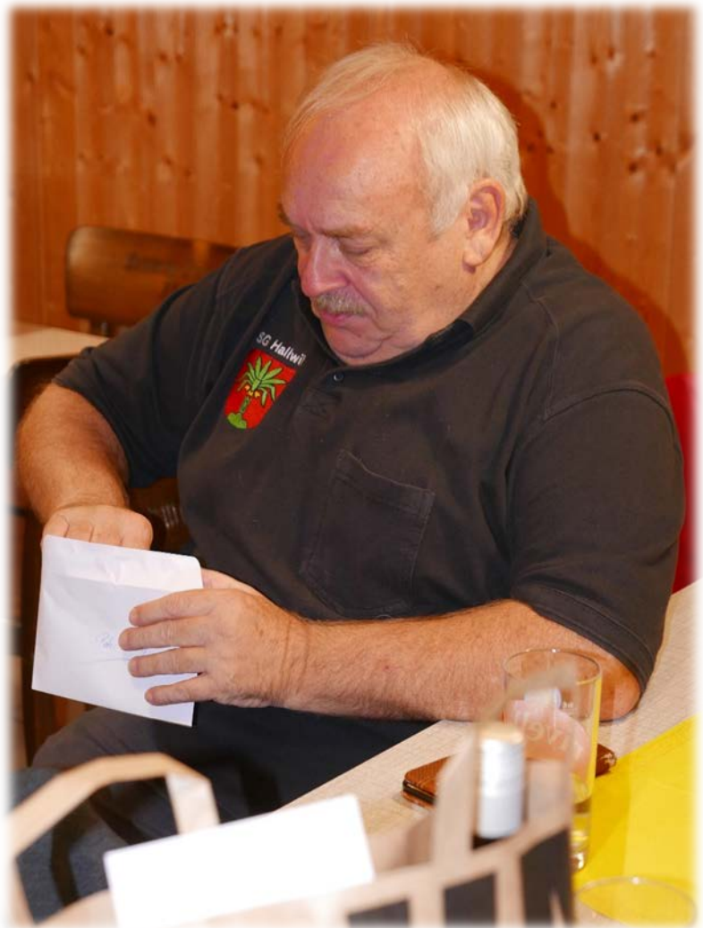
Nur Bares ist Wahres!